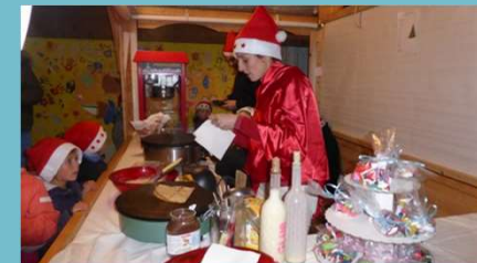
Marché de Noël