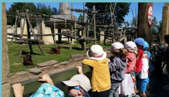
Sortie au Zoo