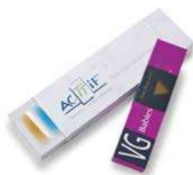
Fourreau et bague